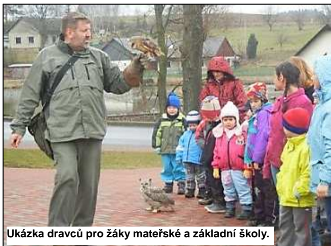
Ukázka dravců pro žáky mateřské a základní školy.