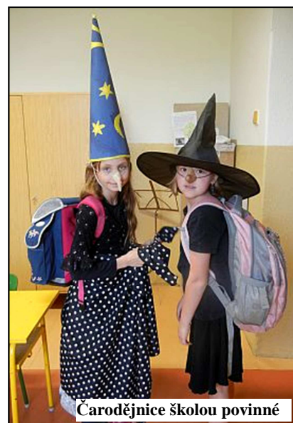
Čarodějnice školou povinné